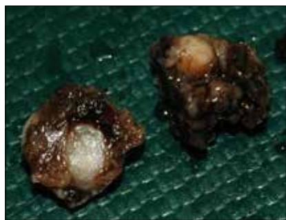
Рис. 2. Округлые образования бело-серого цвета с плотной блестящей капсулой диаметром 2-3 мм в конгломерате тканей, удаленных из орбиты. Операционный материал