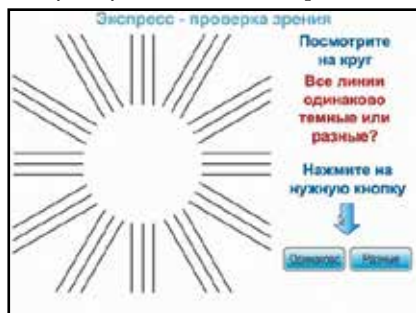
Рис. 3. Оценка наличия астигматического компонента рефракции

3. Тест «лучистая фигура» позволяет выявить астигматизм путем субъективной оценки четкости видения разнонаправленных отрезков лучистой фигуры (рис. 3). Если оптика глаза сферична, то обследуемый не будет указывать на эти различия.