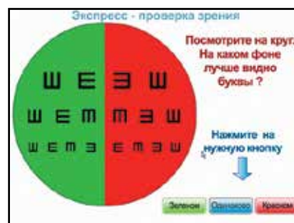
Рис. 2. Определение состояния рефракции на момент проведения скрининга

2. Определение состояния динамической рефракции (совокупности клинической рефракции и напряжения аккомодации) школьника на момент проведения обследования, ее сдвиг в сторону гиперметропии или миопии – дуохромный тест (рис. 2): с близорукостью человек видит более четкими оптометры, расположенные на красном фоне, а с дальнозоркостью – на зеленом. Тест является значимым – контроль рефракции на фоне школьной зрительной нагрузки позволяет судить о функциональной готовности к ней ребенка. Смещение динамической рефракции школьника в сторону близорукости позволяет сделать вывод о том, что аккомодационный аппарат органа зрения ребенка в процессе школьной зрительной нагрузки находится в состоянии функцио-