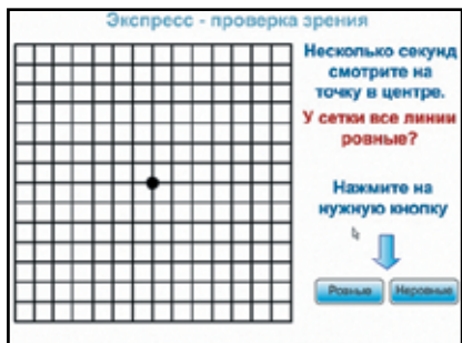
Рис. 4. Оценка состояния макулярной зоны

4. Тест Амслера позволяет косвенно выявить или исключить патологию макулярной зоны – участка сетчатки, ответственного за состояние центрального зрения (рис. 4).