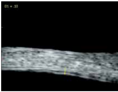
Рис. 1. УБМ-снимок пациента Т. с III активной стадией РН: на крайней периферии височного сегмента плоская отслойка сетчатки (Н до 0,10 мм)